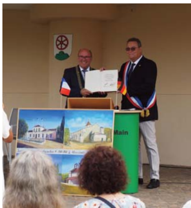
MM. les Maires de Klingenberg et St-Laurent-d'Arce lors de la rencontre de 2022

Le Comité de Jumelage fait appel aux personnes qui accepteraient d'héberger chez elles des membres de la délégation de Klingenberg.