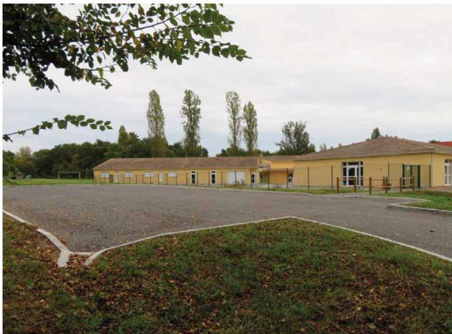
Le nouveau parking de l'école