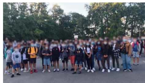
Rentrée des 6ème au collège de Peujard