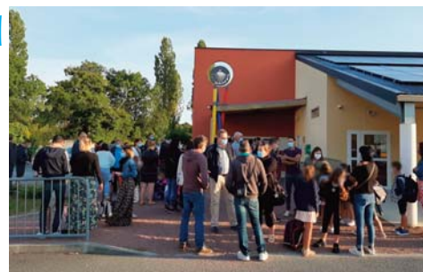
Rentrée à St-Laurent d'Arce